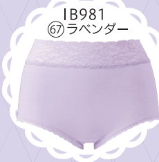
IB981 67 ラベンダー