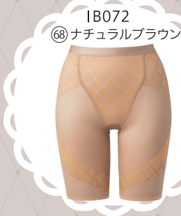
IB072 68 ナチュラルブラウン