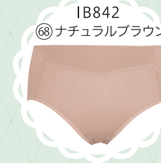
IB842 68 ナチュラルブラウン