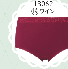
IB062 19 ワイン