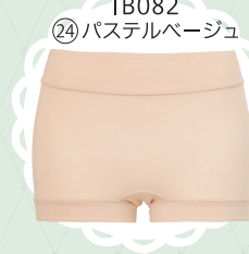
IB082 24 パステルベージュ