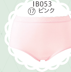
IB053 17 ピンク