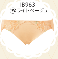
IB963 95 ライトベージュ