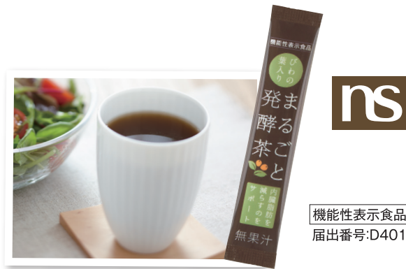
びわの葉入りまるごと発酵茶 NS021

健康食品類では、長崎県の研究機関及び、長崎県立大学、長崎大学、九州大学の研究プロジェクトで開発された製茶法（混合発酵）とお茶の持つ健康成分に着目した当社との産官学の共同開発商品である「びわの葉入りまるごと発酵茶」に内臓脂肪を減らす機能が確認され、この度、機能性表示食品として発売し、売上高は伸長しました。また、前年に新発売した「つやっとハトムギ」の販売状況は堅調に推移しましたが、他の定番商品が低調に推移したことにより、健康食品類全体の売上高は4億81百万円（同0.6%減）となり、前年を下回りました。