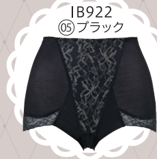
IB922 05 ブラック