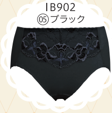
IB902 05 ブラック