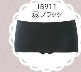
IB911 05 ブラック