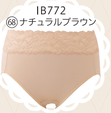
IB772 68 ナチュラルブラウン