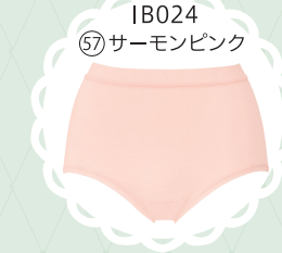
IB024 57 サーモンピンク