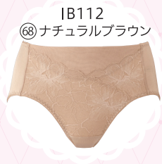
IB112 68 ナチュラルブラウン