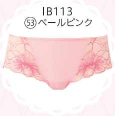
IB113 53 ペールピンク