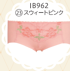
IB962 23 スウィートピンク