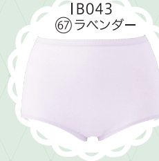
IB043 67 ラベンダー