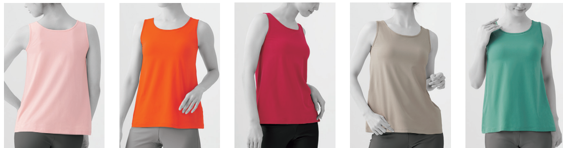
⑤③ ペールピンク ⑦⑥ オレンジ ⑱ レッド ⑧⑩ グレージュ ⑥⑥ グリーン