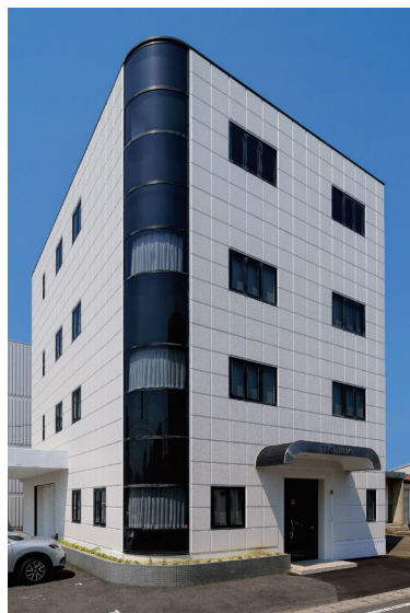
株式会社田中金属製作所 本社・岐阜工場