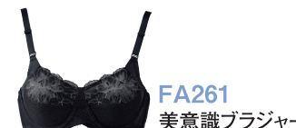
FA261 美意識ブラジャー