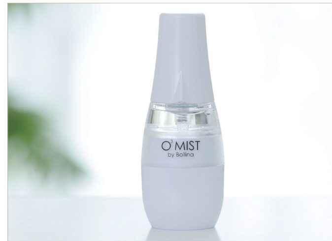
2020年グッドデザイン賞をボリーナオースリーミストが受賞いたしました。

携帯型で持ち歩き自由。水道水や精製水を入れてスイッチに触れるだけで、ウルトラファインバブルを含んだオゾン水をつくれる画期的な製品です。水由来だから人にはやさしく、オゾンのでしっかり除菌と消臭を実現します。