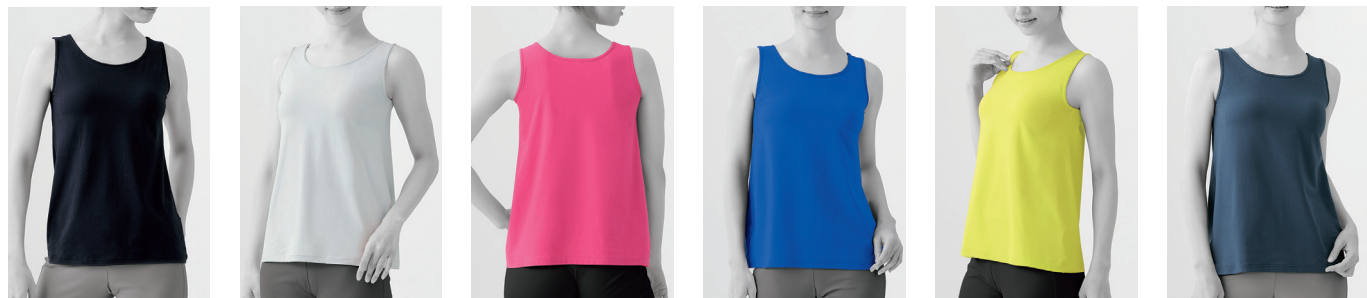
⑤ ブラック ⑦③ ライトグレー ⑤② ローズピンク ④⑧ ロイヤルブルー ⑫ イエロー ⑭ ネイビーブルー