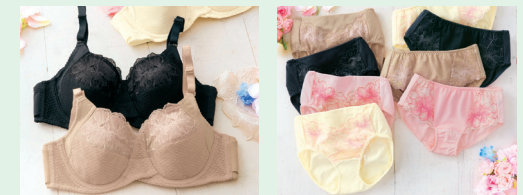
美意識ブラジャー