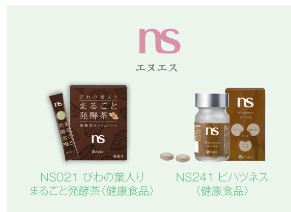
NS021 びわの葉入り まるごと発酵茶(健康食品)

健康食品類では、生の茶葉と生のびわの葉を混合発酵させた発酵茶「びわの葉入り まるごと発酵茶」、ならびに卵黄由来の新規育毛活性成分を配合した女性向けサプリメント「ビハツネス」を新たに発売しました。「びわの葉入り まるごと発酵茶」は、生の茶葉と生のびわの葉を混合発酵させる製茶法を