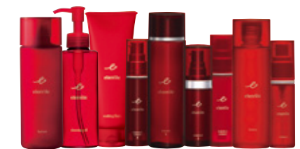
エタリテブランドのスキンケア商品9品