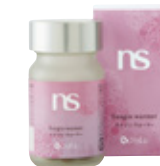
エナジン ウォーマー