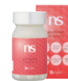
グルコビウォーク