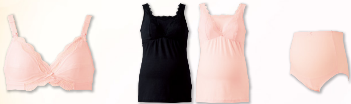
シャルレマタニティ ブラジャー

シャルレマタニティは、お腹の赤ちゃんと母体を守ることを第一に考えた商品作りを続けている株式会社犬印本舗の監修のもとで設計されました。大きく変化する身体への負担を軽減し、産前から産後までを快適に美しくサポートしていきます。