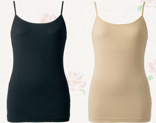
IA691 05 ブラック