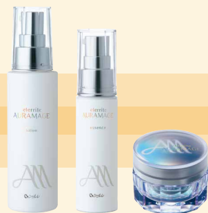
エタリテ オーラマージュ