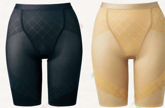
IB072 05 ブラック