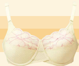
美意識ブラジャー

前年に新たな商材として発売しました健康食品類におきましては、「ns (エヌエス)」ブランドとして4種類の商品展開を図るとともに、インターネット等による通信販売を行う「シャルレダイレクトサービス」に「定期お届け便」制度を導入したことにより、愛用者の拡大を図ることができ、売上高は好調に推移しました。また、健康食品類の全4種類は、2015年モンド・セレクションのダイエット・健康製品部門において全ての商品が金賞を受賞いたしました。