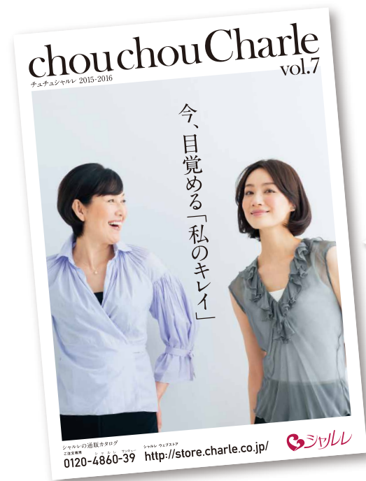
シャルレの通販カタログ「チュチュシャルレ」(無料)