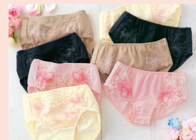
コーディネートショーツ