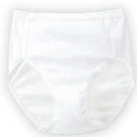
ガールズショーツ CI208