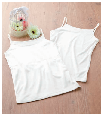
ティーンズインナー(キャミソール・ バスト2重)CI111(左) ティーンズインナー(キャミソール) CI112(右)