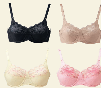
美意識ブラジャー FA261