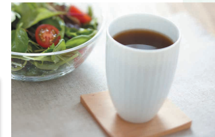
NS021 びわの葉入り まるごと発酵茶(健康食品)

茶葉とびわの葉を混合発酵させ、まるごと粉末状にしているので、食物繊維などの、水やお湯に溶けにくい有用成分までも余すところなく摂取できます。茶葉とびわの葉は、100%長崎県産を使用しており、地域活性につながる商品です。