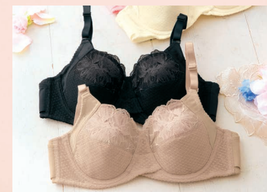
美意識ブラジャー