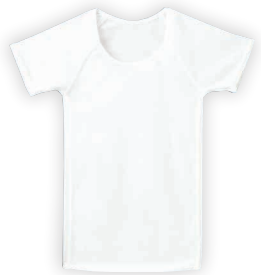
ガールズインナー (半袖)CI109