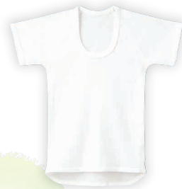
ボーイズ インナー(半袖) CI608