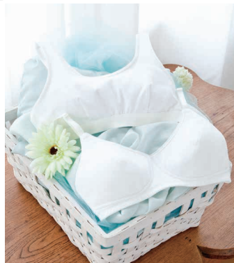
ティーンズソフトブラジャー CF203(上) ティーンズブラジャー CF103(下)

大人より繊細な子どもの肌に、優しく心地よい素材と動きやすさを。 毎日着て洗うから、型くずれしにくく、丈夫に。