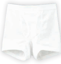
ボーイズ ボクサーブリーフ CI506