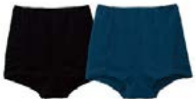
エマージェンシー®インナー(バック状態)