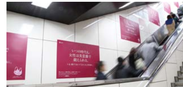
エスカレーター壁面