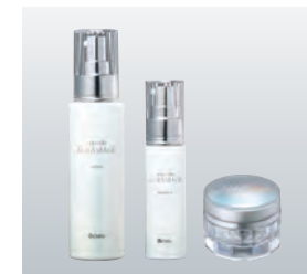
エタリテ オーラマージュ