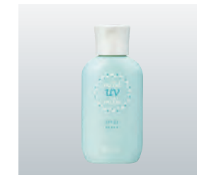
日やけ止め乳液「マイルドUVミルク」

化粧品類につきましては、30代から40代の新たなお客様に向けた商品として、4月に親子で使用が可能な日やけ止め乳液「マイルドUVミルク」を発売いたしました。低刺激で肌に優しい設計であり、肌が敏感な方への紫外線対策として高評価を得ました。また、9月にはエタリテブランド最高峰のエイジングケアライン「エタリテ オーラマージュ」より、新たなご愛用者の獲得を図ると共に、既存のお客様のリピート購入にも繋げることを目的にローション、エッセンス、クリーム限定セットを発売いたしました。