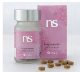
エナジン ウォーマー