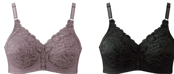
ファンデーション・インナー「ドゥヴァンナシリーズ」 新色ショコラ(左)と新色ブラック(右)