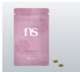
エナジン ウォーマー トライアルパック

ダイエット・健康製品部門で金賞を受賞いたしました。また、より多くのお客様に「エナジン ウォーマー」をお試しいただく取り組みとして、9月からの期間限定でトライアルパックをセットしたキャンペーン商品を発売したところ、計画を上回る売上となりました。